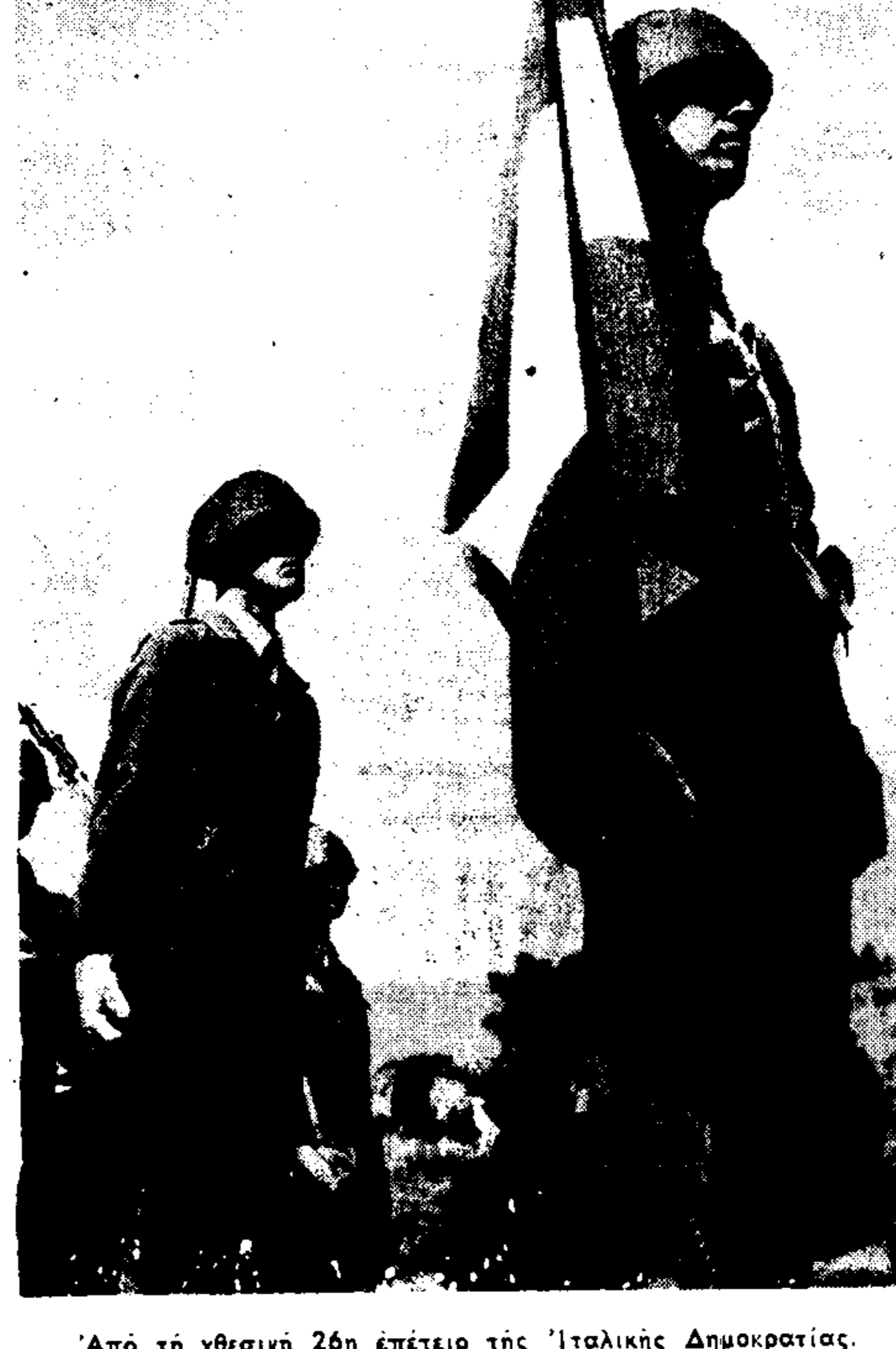
Άπό τη χθεσινή 26η επέτειο της 'Ιταλικής Δημοκρατίας.

Ο πρόεδρος Λέονε επαναλαμβάνει σήμερα τις συνεννοήσεις του με τους ηγέτες των πολιτικών κομμάτων και αναμένεται ότι ή Δεύτερα θα άναβη την έντολή σχηματισμού της νέας κυβέρνησης σε σύλληχος των Χριστιανοδημοκρατών, οι οποίοι είναι τό πρώτο κόμμα της 'Ιταλίας και μόλις έναχρημένο μετά τις τελευταίες γενικές βουλευτικές εκλογές.