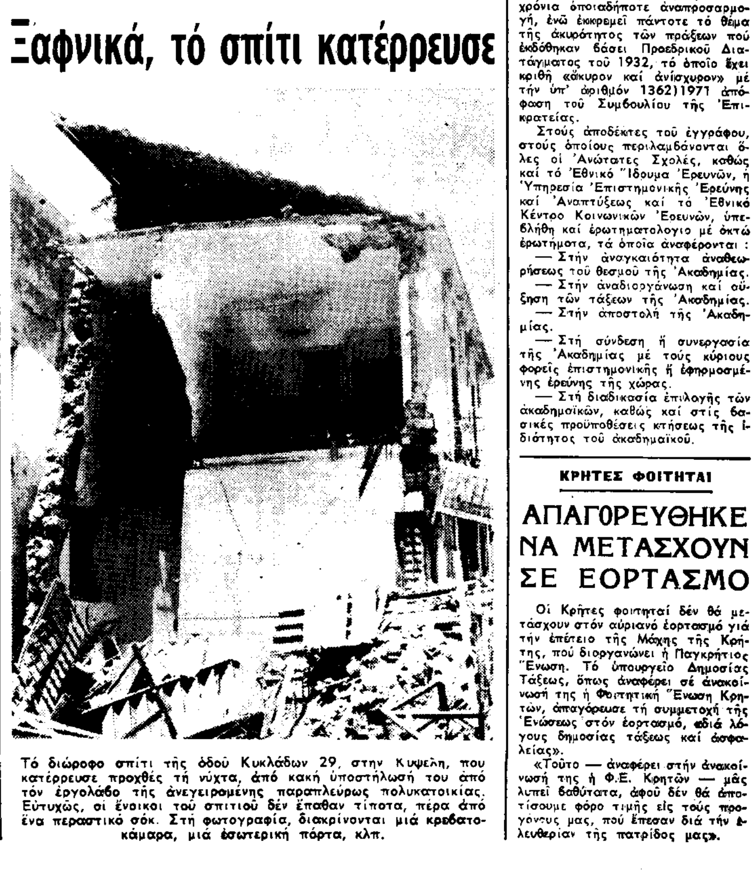
Τό διάφορο σπύτι της όδου Κυκλάδων 29, στην Κυψέλη, που καταρρέσασα προχθές τό νύχτα, από κακή υποστήληση του άπό τον έργοδόχο της άνεγερμένης παραπλεύσας πολυκατοικίας, Έυτυχώς, οι ένδοικοι του σπιτιού δεν έπαθαν τίποτε, πέρα από ένα παραστικό όμαρ. Στη φωτογραφία, διακρίνονται μία κρεβατοκάμαρα, μία έσωτερική πόρτα, κλπ.

Τό ελληνικό φορτηγό «Ταύγετος» προσάραξε χθες σε άμφομή κοντά στο λιμάνι του Τζιμπούτι της 'Αιθιοπίας. Τό πλοίο του, άποτελευτήσασα άπό 19 'Ελληνες και 5 άλλους, είναι καλά. Καταβάλλεται προσπάθεια άποκλήσεως του σκάφους, ενώ πληρούνται οι όροι άποφάσεως 'Επίδουρου, για μεταφορά τμήματος τό φορτίου. Το «Ταύγετος», χωρητικότητας 8.500 τόνων, καταβύθισται με φορτίο 6.500 τόνων στην άκμή της Τζιμπούτι 'Αραβίας.