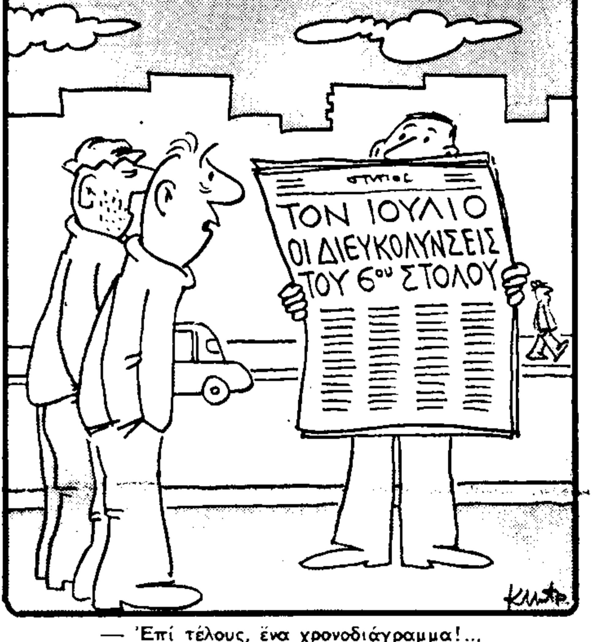
—'Επί τέλους, ένα χρονοδιάγραμμα!...